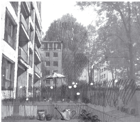
Handskizze aus der Entwurfsfindung / Mietergarten