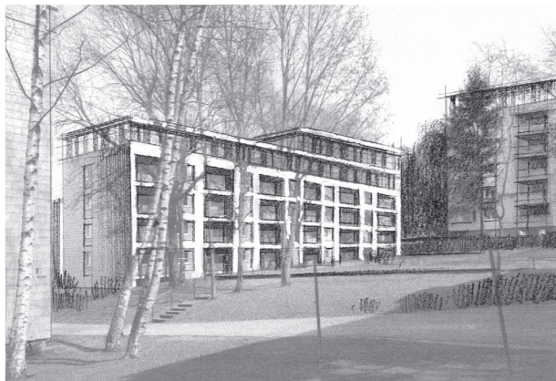
Handskizze aus der Entwurfsfindung / Höhenstaffelung